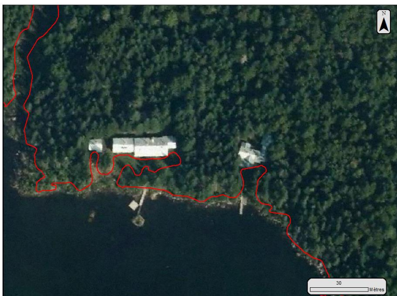
Figure 2. Exemple de contour d'écotone riverain dévié par une ouverture du couvert en face d'un chalet.